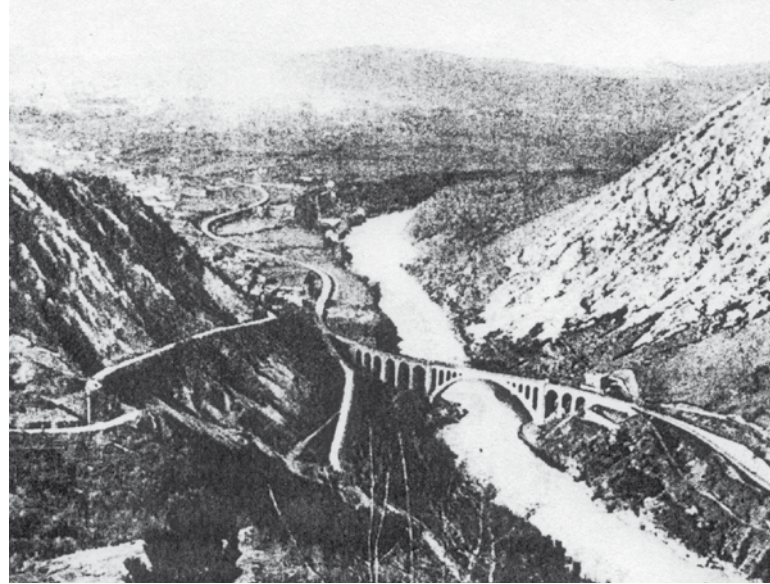
Az Isonzo völgye a Monte Santo felől. A báltérben Görz városa

A lelki harcokban is legyen a Biblia ne csak a zsebünkben a szívünk fölött, de szívünkben is annak életadó szavai és égi ereje, lelki életünk védőpajzsa gyanánt, és lelkünk élete lesz megmentve általa az örök életre.