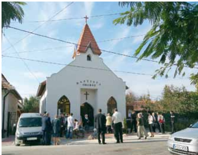
Érkeznek a testvérek...

Ezúton felhívjuk azon kedves Olvasóink figyelmét, akik szeretnék nyomon követni az új kiskunlacházi misszió alakulását, látogassanak el új honlapunkra: www.lachaza.baptist.hu