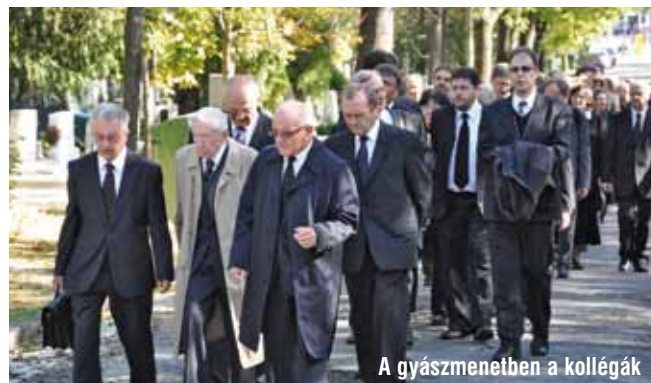
A gyászmeneiében a kollégák