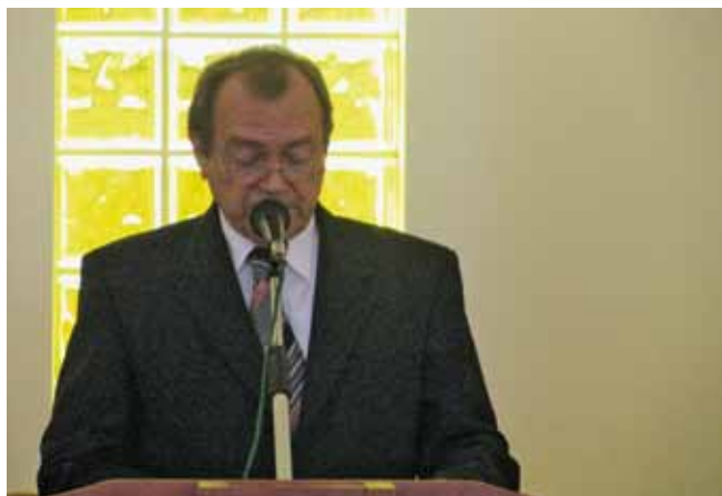
Almási testvér üdvözlí a népes gyülekezetet