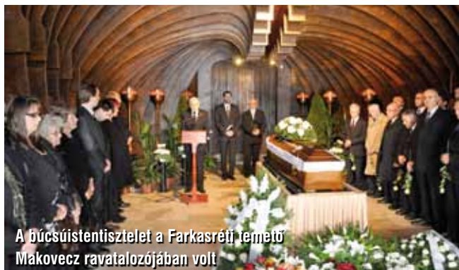
A búcsúistentisztelet a Farkasréti temető Makovecz ravatalozójában volt

„Annak okáért vigasztaljátok egymást e beszédekkel!”