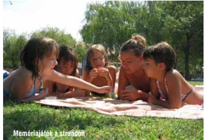
Memóriajáték a strandon