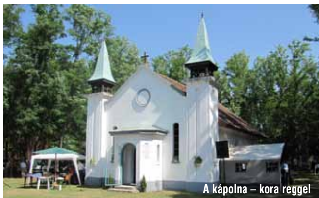
A kápolna – kora reggel