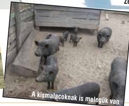
A kismalacoknak is melegük van