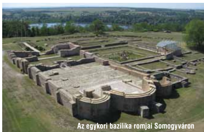
Az egykori bazilika romjai Somogyváron

Reggeli után mindannyian sétálni indultak. A homokos terepen az erőtől duzzadó csapat rendületlenül haladt. Az erdő lakói nem mertek az útjukba állni. Még a szőkepusztai imaház uhuja is elmenekült előlük! Egy gyönyörű tisztáson aztán rátaláltak a csodálatos „székesegyházra”. Kicsiknek és nagyoknak egyaránt elállt a lélegzete. Ilyen csodát még a kerekerdő közepén sem láttak! Áhítattal lépték át az imaház küszöbét, és