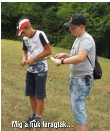
Míg a fiúk faragtak...

Az egész napos fürdőzésben mindenki kellőképpen elfáradt. Pedig különleges este várt rájuk, melyre Libickozma Birodalmának összes alattvalója meghívást kapott. Bizonyára már mindenki kitalálta, hogy csakis táborúzról lehet szó. Valóban így történt, megkapták, meggyújtották, körbeülték, és énekeltek, beszélgettek a tűz körül. És hogy ki ne felejtsem: csörögtek-börögtek, csilingeltek, cincogtak; valamint ütötték, verték, rázták, fújták, pengették... mármint a sok hangszert, amit bárki kipróbálhatott. Volt is nagy lárma, amelyet a falu eddig még nem hallott! Szerencsére nem zavarták haza azonnal a hebehurgya társaságot, hanem megengedték, hogy még egy-két napot ott maradjanak. Nyugodt szívvel hajtották tehát