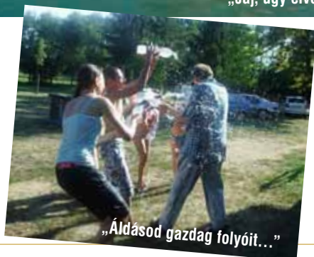
„Áldásod gazdag folyóit...”