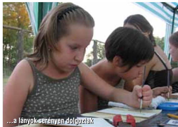
...a lányok serényen dolgoztak