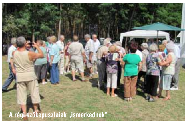
A régi szőkepusztaiak „ismerkednek”