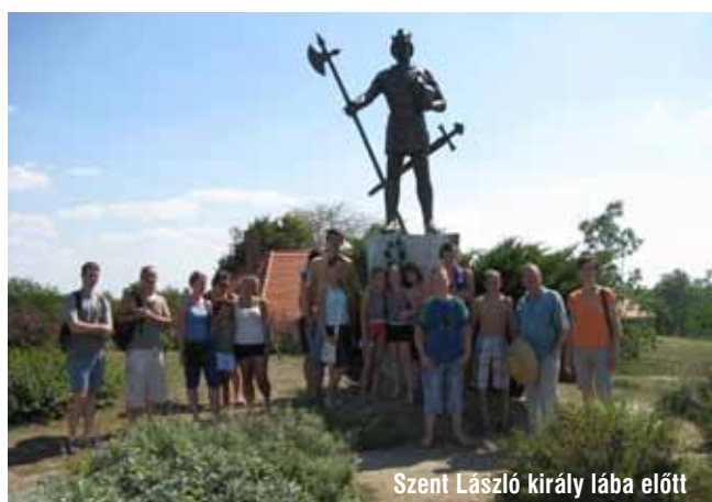
Szent László király lába előtt

Közben kipurciózták a reggelit, majd asztalhoz hívták őket. Egy perc múlva már mindenki a szokásos helyén ült, és elkezdődött a reggeli. A „terülj, terülj, asztalkám” most is a két konyhatündér kezét dicsérte.