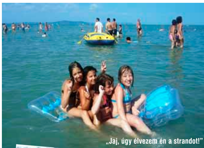
„Jaj, úgy élvezem én a strandot!”