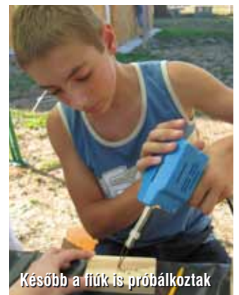
Később a fiúk is próbálkoztak