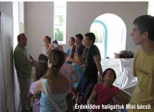
Érdeklődve hallgattuk Misi bácsit