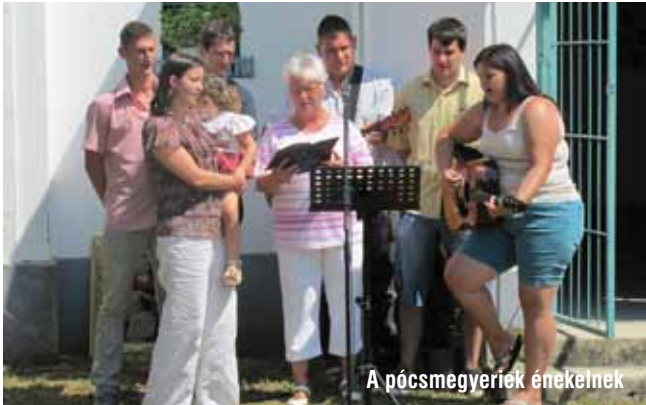
A pócsmegyeriek énekelnek