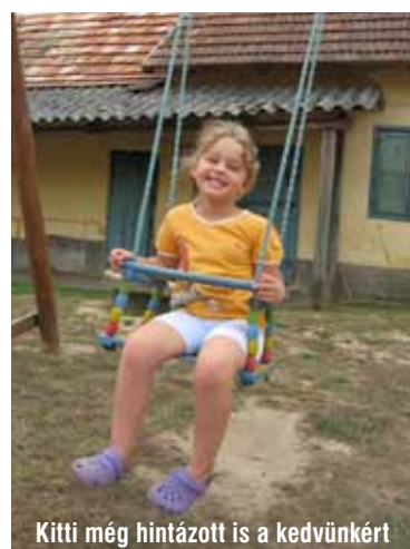
Kitti még hintázott is a kedvünkért

álomra a fejüket, és szinte mindannyian azonnal el is aludtak.