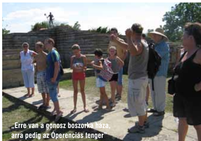
„Erre van a gonosz boszorka háza, arra pedig az Óperenciás tenger”