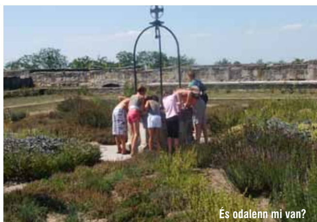
És odalenn mi van?