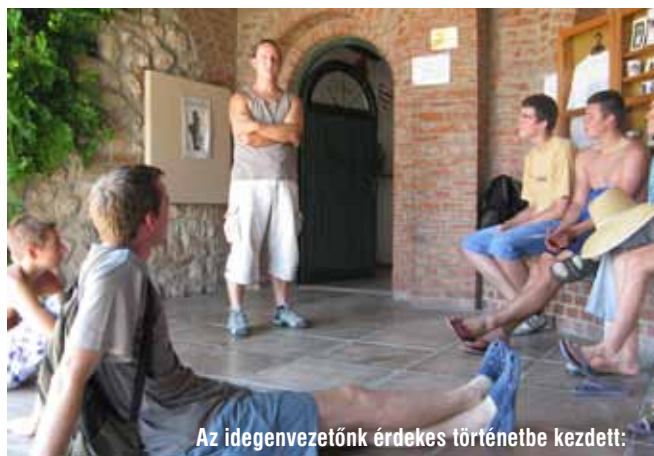
Az idegenvezetőnk érdekes történetbe kezdett: