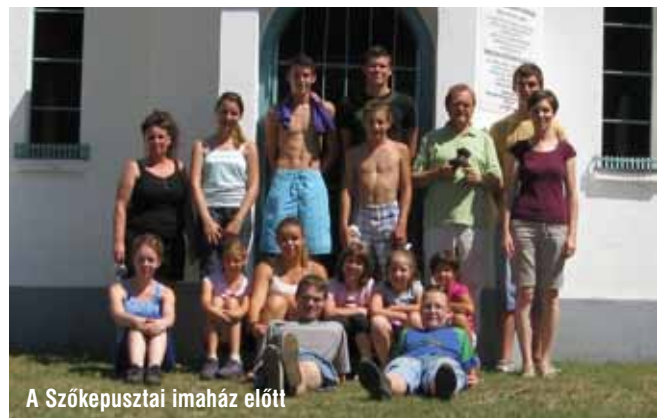
A Szőkepusztai imaház előtt

Szerdán fárasztó nap elé néztek a tábor lakói. Megint egy meleg nap várt rájuk. Az ébresztő után lassan kitá-molyogtak sátraikból, és az éjszaka átfagyott testrészeiket a nap sugaraiban próbálták átmelegíteni.