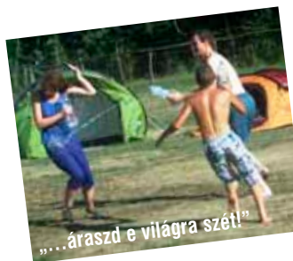
„...áraszd e világra szét!”