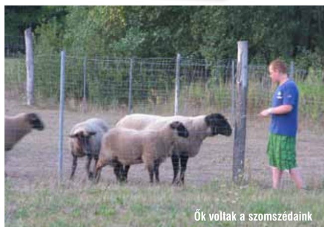
Ők voltak a szomszédaink