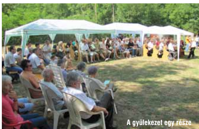
A gyülekezet egy része