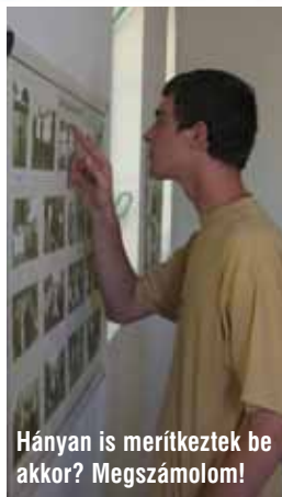
Hányan is merítkeztek be akkor? Megszámolom!