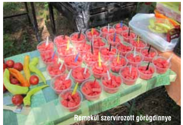
Remekül szervírozott görögdinnye