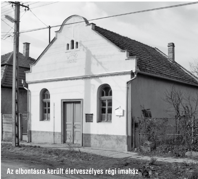
Az elbontásra került életveszélyes régi imaház

A Dömsödi Baptista Gyülekezet és Körzet testvérisége úgy határozott, hogy a kiskunlacházi – annak idején igazán mívesen megépített, de ma már életveszélyes – imaház helyére újat épít. Sokéves előkészület, gyűjtés előzte meg a döntést. Hálásak vagyunk az Úrnak azért, hogy ez év március 5-én megkezdődött a nagy munka.