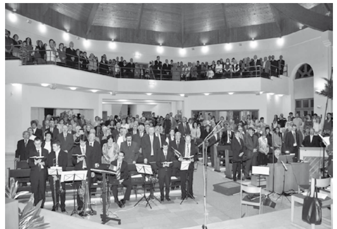
Újra nagy élmény volt a záróének, a „Feltámadt Hős...”