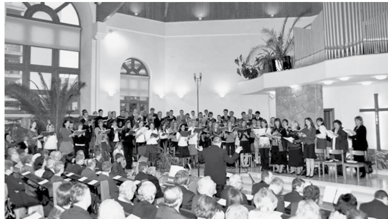
Az összevont énekkar énekel

E jelentős istentisztelet mottója: Az első szeretet tüze nagy érték, amit Jézus is keresett. Hasonló tűzzel,