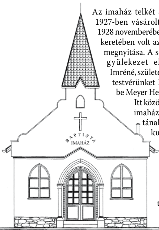
Az új imaház homlokzati rajza