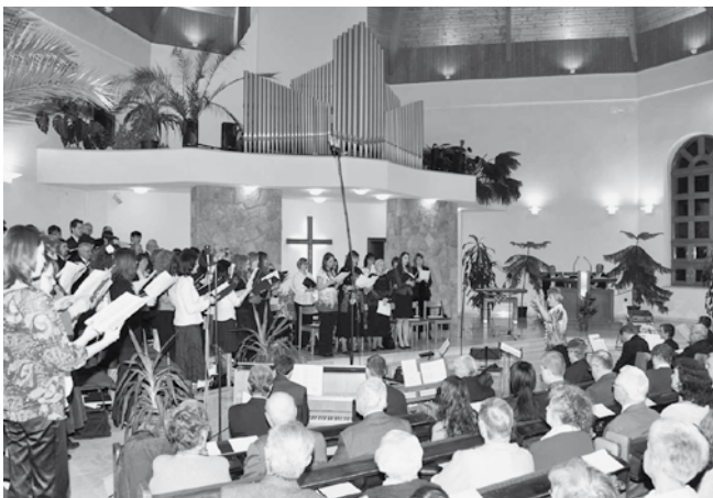
„Zengjétek Jézus nagy voltát!...”