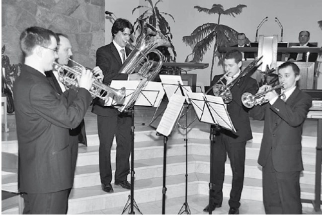
A Prima Primmissima Junior Díjas fúvós ötös