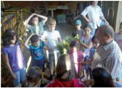
A pajtába besűrődő fény és mi