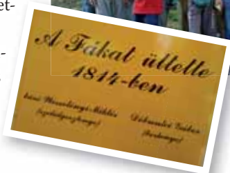
Az ősi „Berzsényi fánál” (szelíd gesztenye)

Kedd reggel elindultunk Pesterzsébetre. Az ottani imaház előtt volt a találkozó, és onnan indultunk Szőkepusztára egy mikrobuszal, ahol finom ebéddel vártak a kedves szakácsnénik. Délután kirándultunk a tavakhoz, majd este szarvaslesre megcsillagnézésre mentünk.