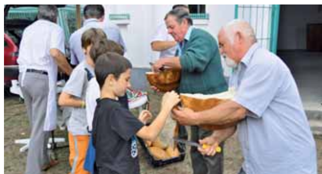
Az ünnepi új kenyérből mindenki részesült a szökepusztai konferencián

Felfigyeltem egy bibliai kifejezésre: „Kenyeret botját eltöri” (Éz 4.16, 5:16). Az ősidőkben lepény vagy lángos formájú, kerek kenyereket sütöttek. A maradékokat nem tarisznyába tették, hanem egy vékony botra fűzték, és vállon vitték, hogy meg ne penészedjék, hogy száraz maradjon. Nem késsel vágták a kenyeret, hanem törték – a kerek lapokból. Könnyű volt nekik, mert akkor még mindenki „s.k.” tudott törni, és „s.f.” tudott harapni, rágni. (S.k.=saját kezűleg, s.f.=saját fogúlag)