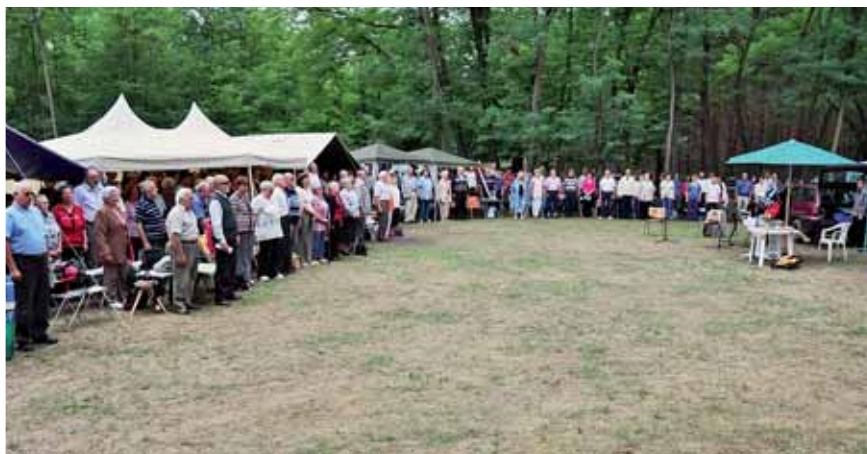
A konferencia végén a Himmuszt éneklő gyülekezet