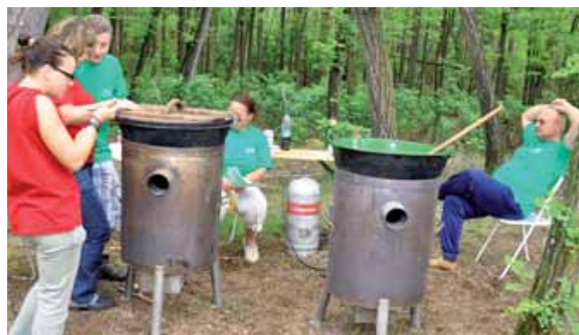
Két üst a hat közül, meg az „egyenruhás” monoriak