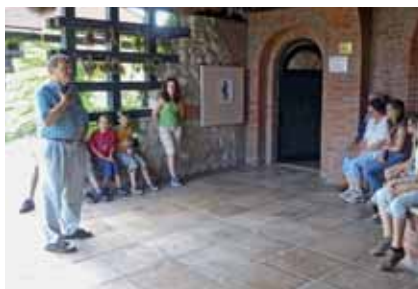
Kezdődik a „tárlatvezetés” Somogyvárott

kokra. Utolsó este nagy tábortűz volt, miközben sokat énekeltünk.