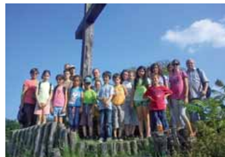
Az ősi temető fölött