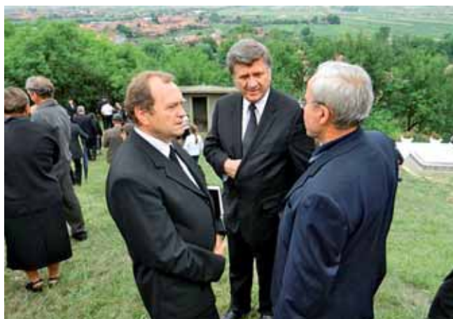
A gyönyörű magyar nagyközség a temetőből a gyászszeretáson végén