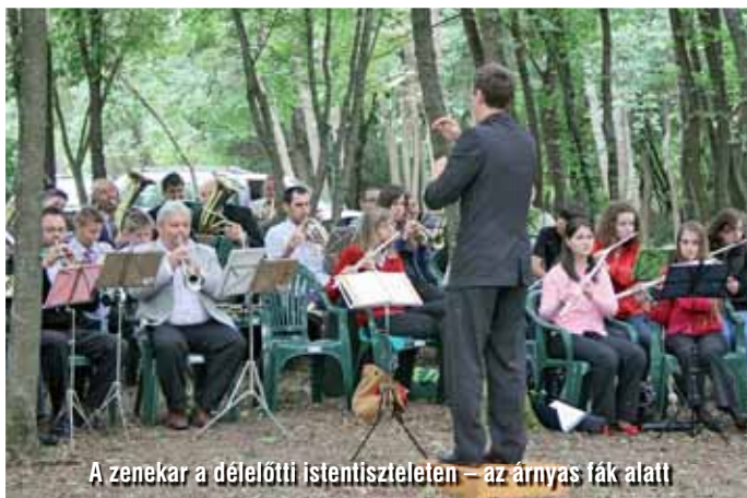
A zenekar a délelőtti istentiszteleten – az árnyas fák alatt