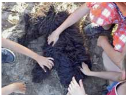
Filó, a fajtisza magyar puli közszeretben

Legkedvesebb élményeim a kirándulások és a foglalkozások voltak. Mentünk a Képesfához és a tavakhoz, ahol játszott-