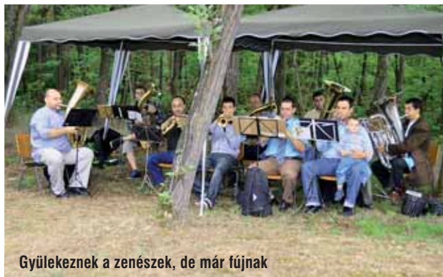
Gyülekeznek a zenészek, de már fújnak

Tartottunk tőle, hogy a változékony időjárás elrontja a hangulatot, de olyan gyönyörű vasárnapot kaptunk az Úrtól július 31-én, hogy mindenki felszabadult szívvel tudott ünnepelni.