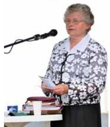
Oláh Lajosné Torontóból érkezett, egy verssel szolgált közöttünk