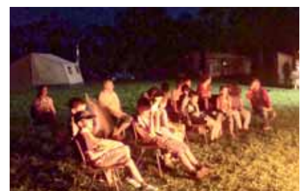
A legkitartóbbak a tábortűz fényénél