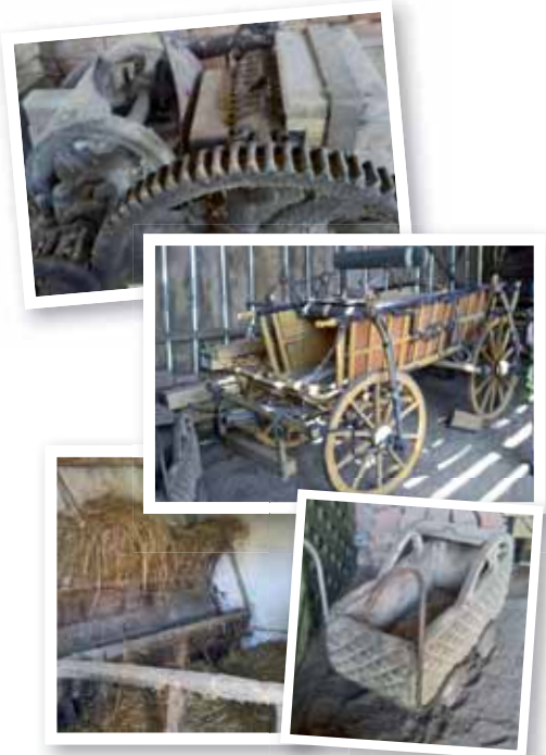
Régiségek között. A szecskavágó „lényege”, „lőcsős” kocsi avagy falusi hintó, „kocsi” piciknek is, a jászolban pedig friss széna várja a lovakat

sok voltak és kirándulás. Nagyon jó és izgalmas volt, este sokáig fennmaradhattunk.