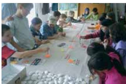
Kézműves foglalkozás. Remekművek születtek

Legkedvesebb élményeim a kirándulások és a foglalkozások voltak. Mentünk a Képesfához és a tavakhoz, ahol játszott-