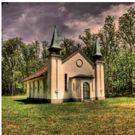
a zarándokkápolnáról