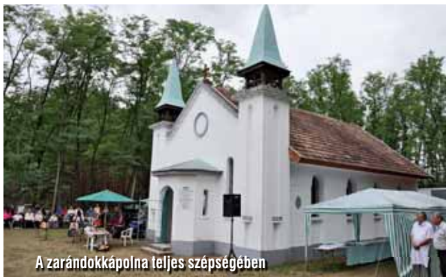
A zarándokkápolna teljes szépségében

„Emlékezzetek a korábbi napokra!” Zsid 10: 32.