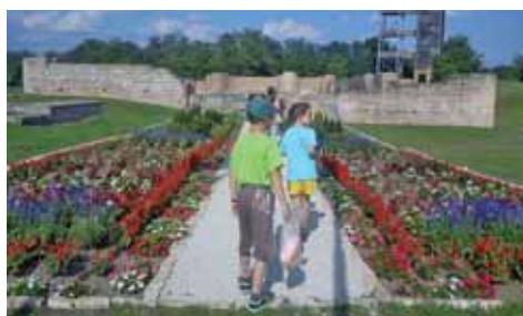
A keskeny ösvény a bazilika főbejáratához vezet (háttérben a kilátó, ahonnan ellátni a Balatonig)

tünk a kb. 2 km-re lévő Képesfához. Pénteken elmentünk a szőkepusztai imaházhoz. Egész héten lehetett gyűjteni pontokat, amit pénteken váltottunk be. Este tábortűz volt.