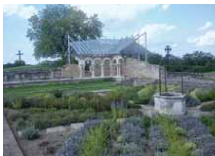
A kolostor udvar részlete

játszani. Második éjszaka nagy eső volt, így a matracokat, amiken aludtunk behordtuk a házba és a garázsba. A lányok a házban, a fiúk a garázsban aludtak. Volt még sokféle foglalkozás és játék.