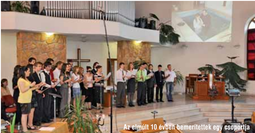
Az elmúlt 10 évben bemeztettek egy csoportja

lyozta, hogy nem nekünk kell keresgél- ni, hanem nyitott szívvel Isten elé kell vinni ügyünket és meg kell hallani az Ő választát. Hála legyen az Úrnak, aki valóban meghallgatta imáinkat és válaszolt azokra.