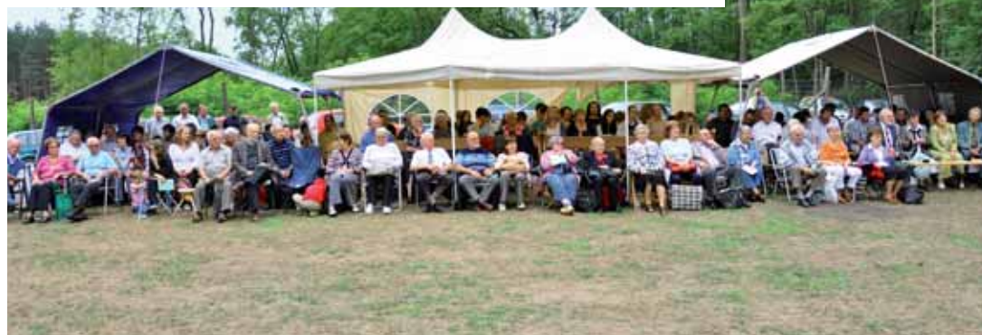
A „középmezőny” a két katonai- és a török-sátor alatt