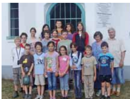
A táborlakók a szőkepusztai imaház előtt

Ki ne felejtsem azt, hogy a pontokat a hétvégén beválhattuk értékes ajándé-