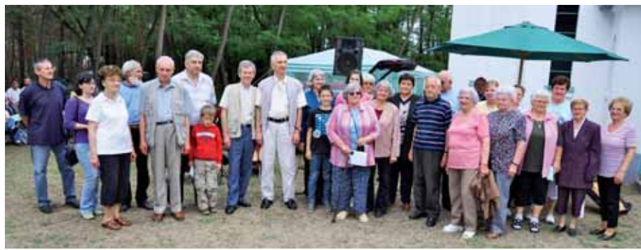
Volt szőkepusztaiak gyerekekkel, unokákkal