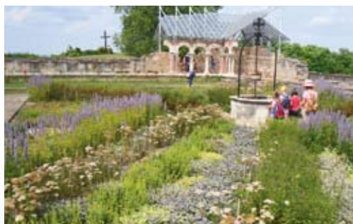
A bazilika kerengője és a szerzetesek fűszerkertjének egy része, valamint a kút