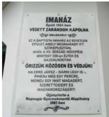
A Zarándokkápolna imádkozni hív a somogyi rengeteg közepén