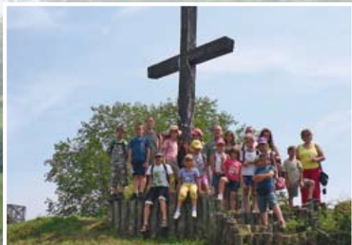
A hajdani várfokon