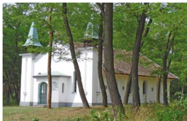
A Zarándokkápolna jövőre is vár mindenkit!