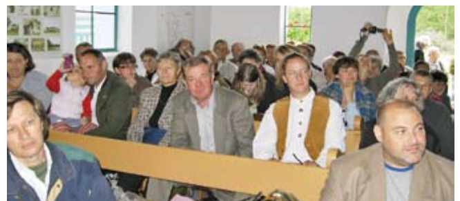
A „benti gyülekezet” egy része