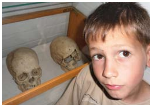
Somogyvár, „ősmagyar” és mai koponyák