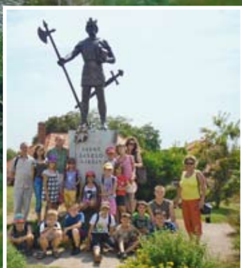
Szent László bronz szobra körül