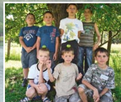
„Fiúkör” a 100 éves almafa alatt