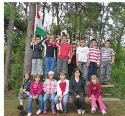
Érkezés a tavakhoz