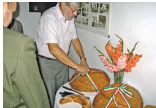
Az ünnepi kenyerek megszegése következik...