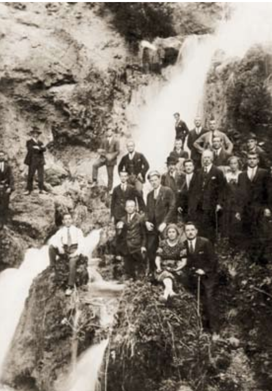
Semináristák és tanáraik egy kiránduláson a Szinva vízesésénél 1927-ben

A háború alatt az istentiszteletek megtartása is veszélybe került. Az imaház ajtajában halt meg egy ember, akit lelőttek. Az imaház udvarán kellett ideiglenesen eltemetni. (folytatjuk)