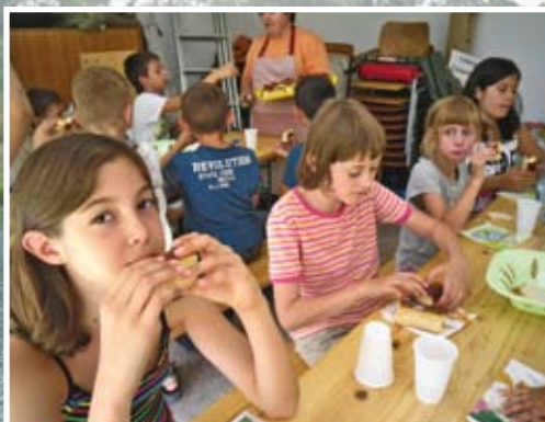
Uzsonna, lekváros és túrós bukta