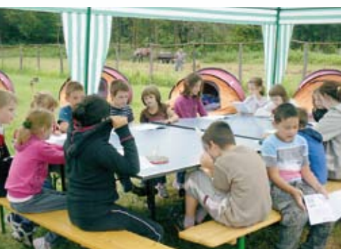
Bibliai foglalkozás Debivel, háttérben szénagyűjtés