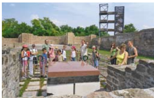
Szent László király sírhelye