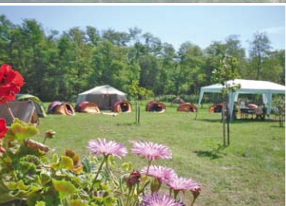
Virágok és sátrak