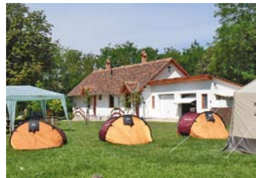
A sáttábor egy része