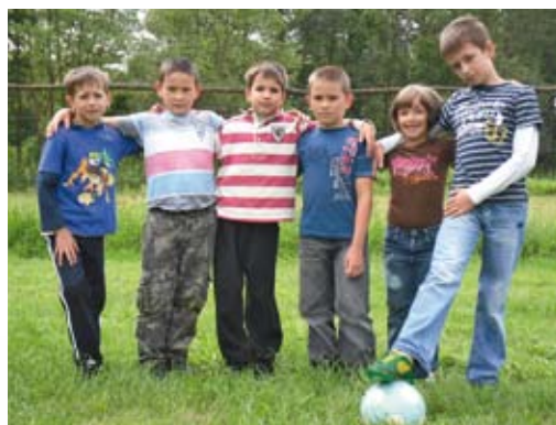
Az egyik csapat