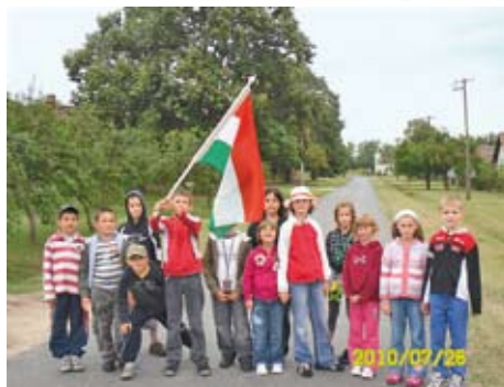
Indul a csapat