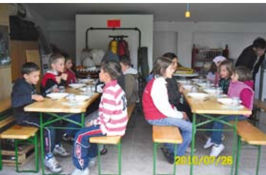
„Gyereksarok” – az első ebédhez készülve