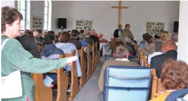
Az esős idő miatt a szabadtéri konferencia résztvevőinek egy része „beszorult” az imaházba. A többiek két sátorban erősítőn keresztül hallgatták az istentiszteletet.