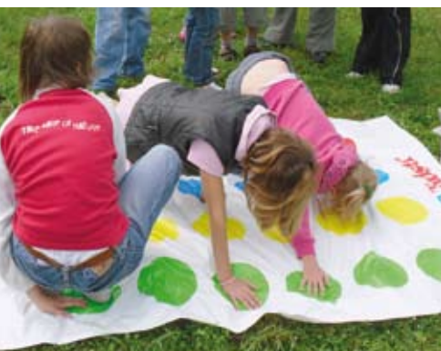
Ez jó játék