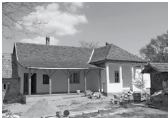
... meg a járda, meg a fű, meg a kerítés, a kút átépítése, és persze az összes gazdasági épület rendbetétele...