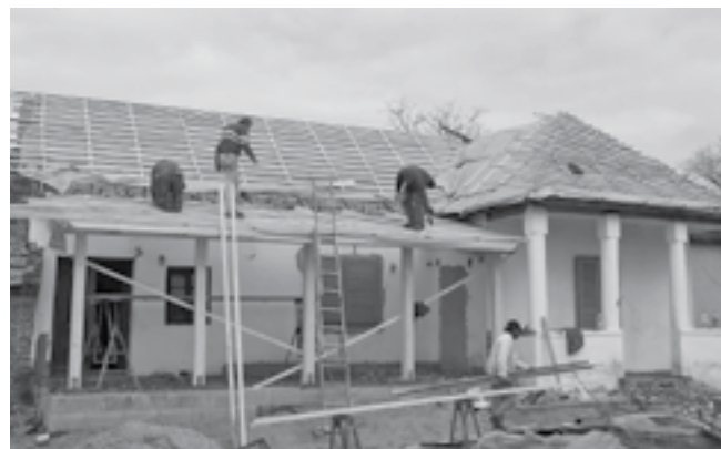
Az udvar felől egy új 24 m 2 -es terasz épült