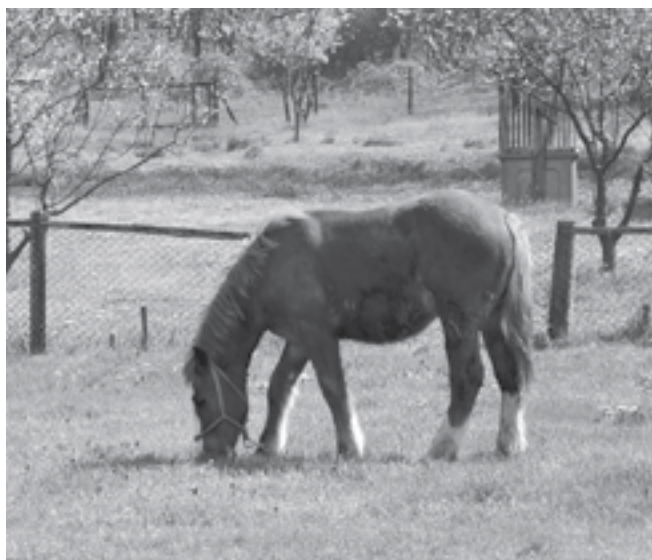
Az út szélén, szemben a házzal, a legelésző lovak egyike