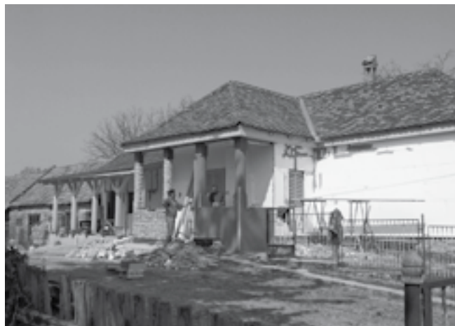
A főbejárat romos oszlopait az alappal és falakkal együtt cserélni kellett