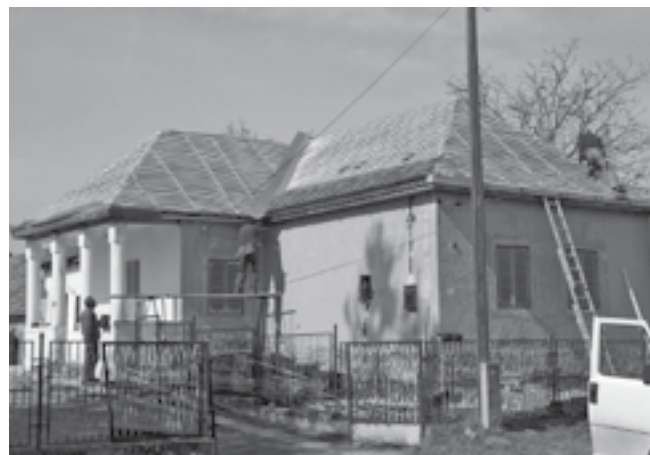
A töredezett 50 éves pala helyett jó minőségű bontott hódfarkú cserép kerül az épületre