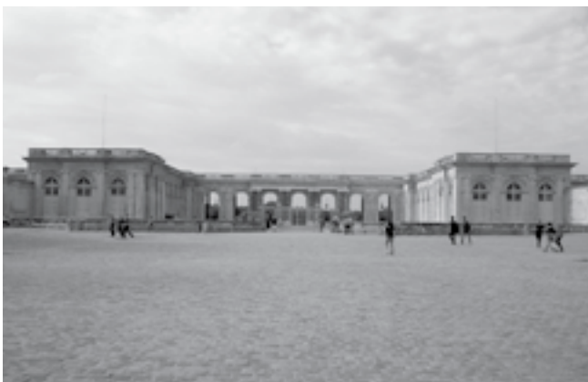
A „békeszerződés” aláírásának helyszíne