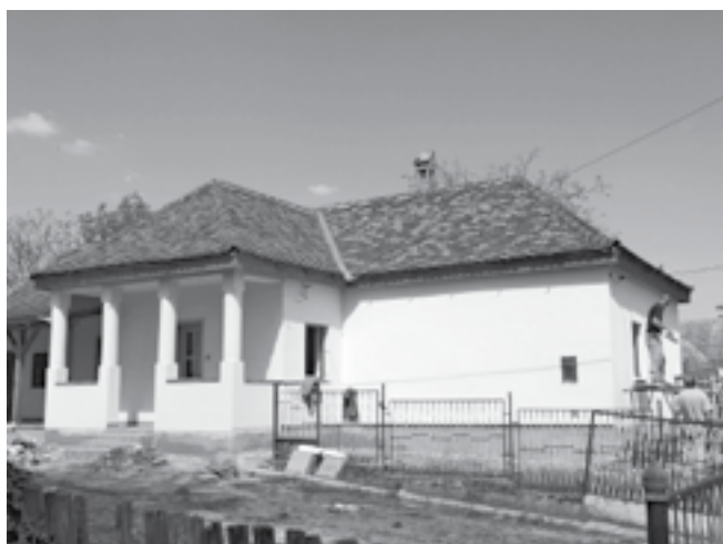
Már csak a csatorna hiányzik...