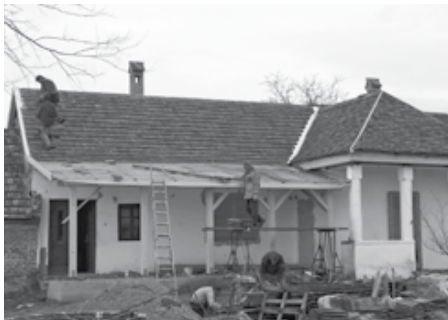
A tető már majdnem kész...