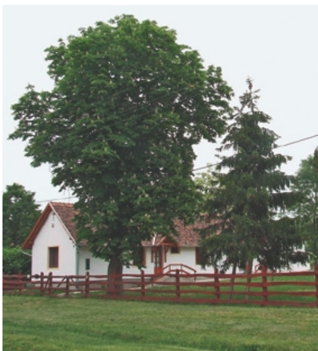
A megújult gyermektábor készen várja nyári lakóit

Imádkozunk azért, hogy kellemes és áldásos legyen a konferencia!