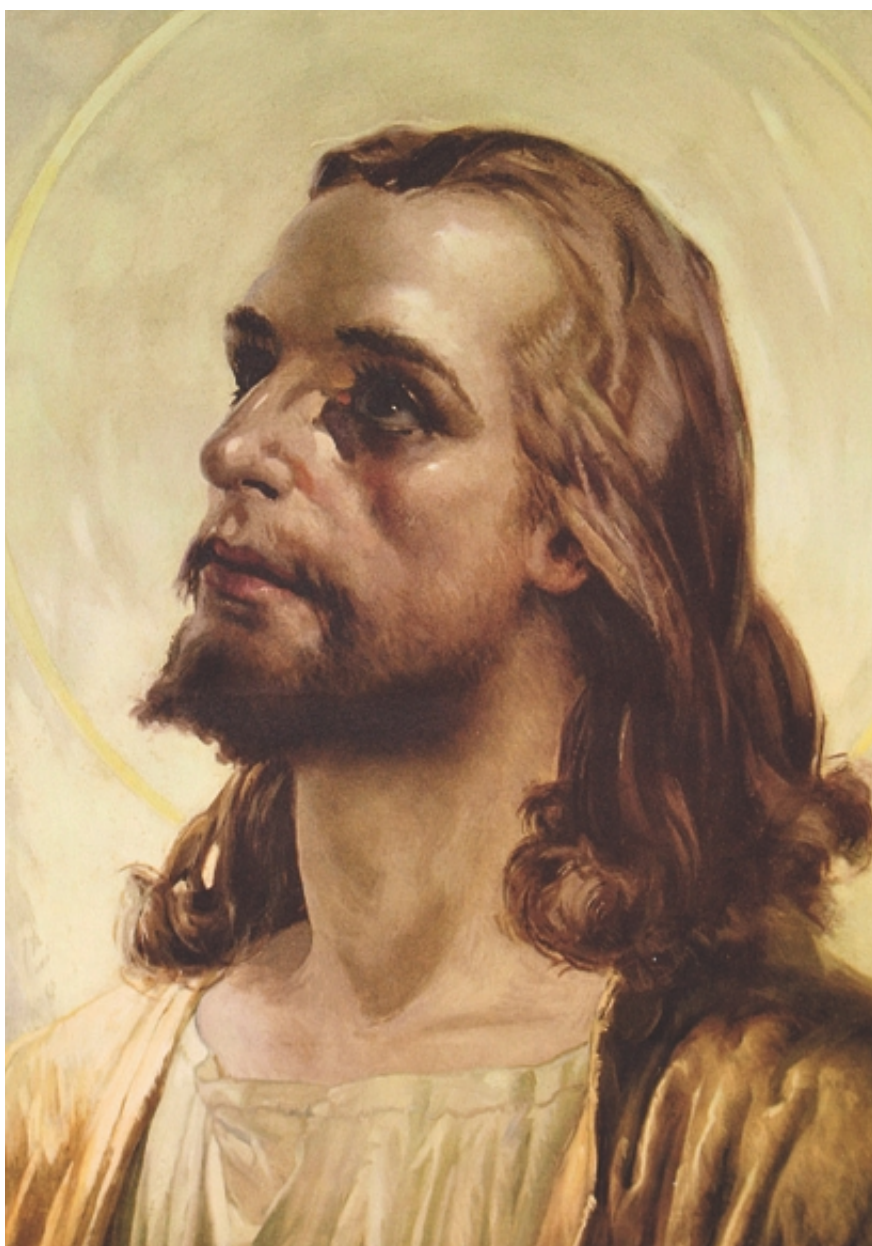
Jámbor Lajos: A Názáreti Jézus

A boldog várakozás negyedik hónapjában, május 16-án egy kötelező ellenőrző vizsgálat kimutatta, hogy a várt gyermek rendellenességgel fejlődik az anyaméhben. Két-három hétig tartó tortúra következett. A klinika szakemberei, az intézmény védelmében, mindent megtettek tájékoztatá-