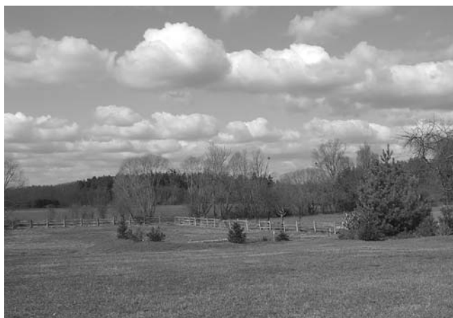
A szomszéd telke még zöldebb – március közepén –, de hamarosan a mi portáink is így fognak kinézni