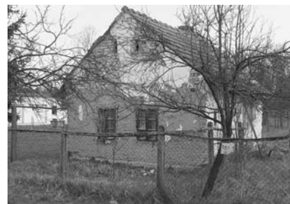
Ebből a házikóból, amely közvetlenül a gyermektábor „szomszédja”, a nyári táborozáskor szükséges raktár lenne terveink szerint

Amikor folyamatosan beszámolunk arról, hogy az Úr milyen módon vezet bennünket, nem dicsekszünk, hanem bizonytságot teszünk arról, hogy ő hű marad és