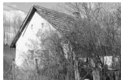
Ezt a kis omladozó házat pedig eredeti szépségében szeretnénk felújítani, korhű berendezéssel, amolyan örökségápoló szándékkal a gyermektábor utáni második telken

betartja ígéreteit. Biztosak vagyunk abban, hogy Szőkepuszta nem csak a múlt emléke, hanem a jelen és a jövő misszió – kiemelten a gyermek és ifjúsági munka egyik meghatározó helyszíne lehet sokkal olcsóbban, mint bérelt táborhelyek, és sokkal meghittebb, bensőségesebb légkört biztosítva, hisz nem egy idegen hely, hanem Isten ajándéka erre a konkrét célra.