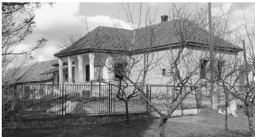
Ez a ház, amelynek felújítása most zajlik, az idei nyártól kezdve a táborvezetők lakhelyeként szolgál

Előző számunkban már hírül adtuk, hogy a tél folyamán sikerült megvásárolnunk két telket, a gyermektábor és a parkerdő között, így egybefüggően mintegy két hektár terület szolgálhatja a tábor bővítését. (Ezen felül van a kápolna, egy hektár rét és egy erdős telek a kápolna szomszédságában.)