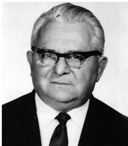
Kovács Imre (1903–1991)