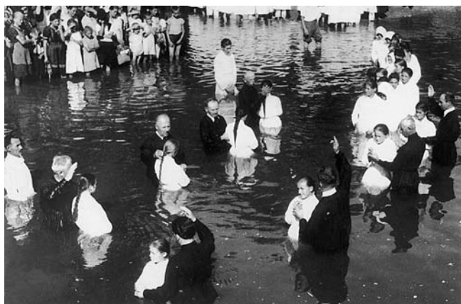
Bemerítés Szilágynagyfaluban a helyi baptista misszió 50. évfordulója alkalmából rendezett ünnepen (1946. augusztus 17–18.) Nyolc lelkipásztor összesen 82 fehérruhást merített alá a Berettyó vizében

És idézett Jeremiás próféta könyvéből egy verset: „Azt gondoltam: nem törődöm vele, nem szólok többé az ő nevében. De per-