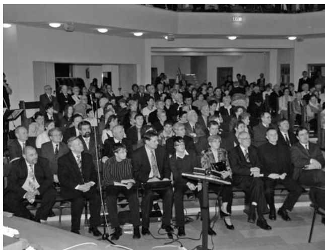
Az oldalhajóban az első sorokban a szolgáló lelkipásztorok