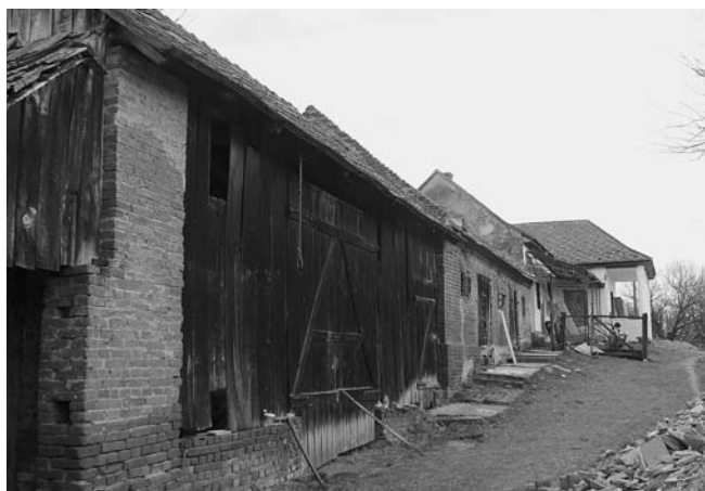
A hatalmas szénapajta – amolyan turista- vagy menedékház funkcióval – átépítés után kb. 40 főnek tud friss illatos szálláshelyet biztosítani