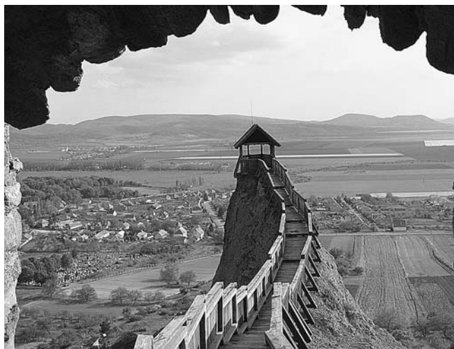
A „pengesziklára” épült megfigyelőállás