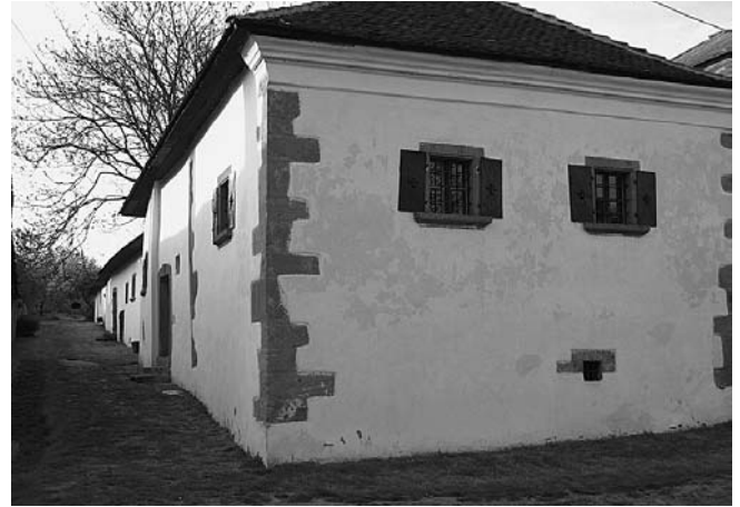
A gönci „huszita ház” utcai homlokzatán látszik, hogy védelmi célokat is szolgált