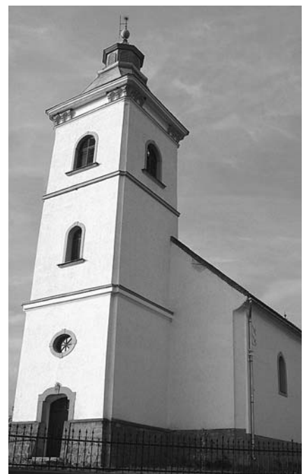
A mai Gönc református temploma