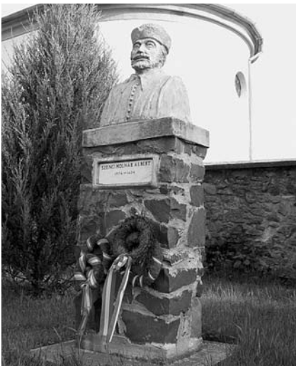
Szenci M. A. szobra a vizsolyi templomkertben