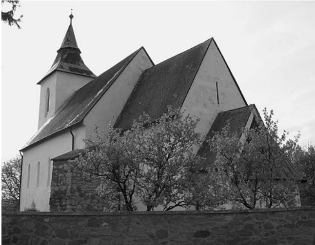
A vízolyi református templom a fő út felől