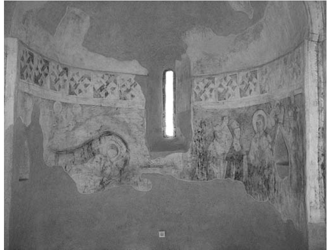
A legősibb, XIII. századi kápolna előkerült és részben restaurált freskói