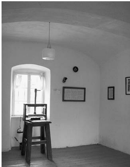
Ezen a helyen állt – a kutatás mai állása szerint – az a nyomda, ahol a Károli Bibliát nyomtatták

Egy verőfényes május eleji napon fölkerestük néhányan ezt a vidéket – pontosabban ennek a Hernád völgyeként, illetve a Zempléni Tájvédelmi Körzetként ismert részét. Miskolcra indultunk és Hernádnémeti meg Meggyaszó érintésével először Monokon álltunk meg. Köztudott, hogy itt született Kossuth Lajos . A település példásan őrzi Kossuth emlékét. Tér, szobor, szülőház... Abaújszántónál tértünk le a Zemplén felé és természetesen megálltunk Boldogkőújfalun és fölmentünk az egyedülálló szépségű Boldogkő várba. Nem akarok elakadni a vár történe-