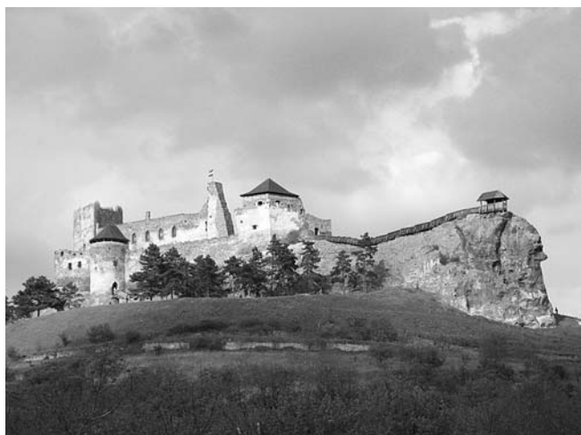
Vizsoly felé haladva először Boldogkőváralján álltunk meg és „bevettük” a várat