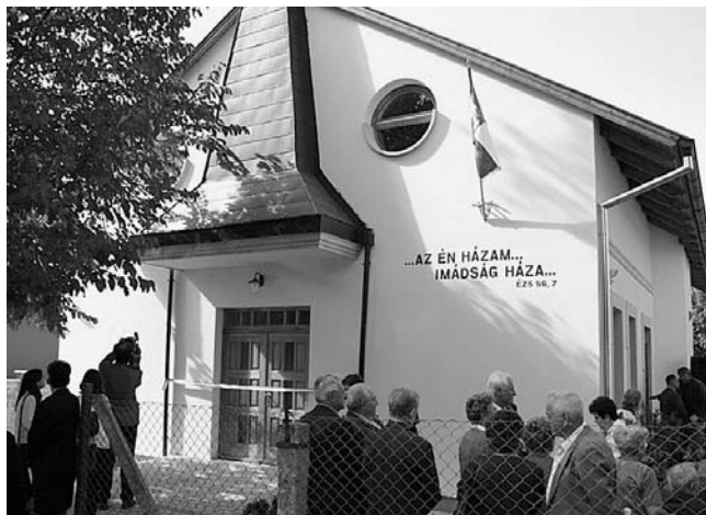
Ebben a templomban szól a Jó Pásztor kazettáról a harangszó vasárnapról vasárnapra

Mindössze 11 éves fiúcska volt, amikor 1958-ban, az utolsó szökepusztai bemenítési ünnepen ott volt szüleivel együtt. Nemeskísfaludról, a nagykiterjedésű körzet egyik állomásáról mentek át lovas kocsival, a hívők egyik legszebb ünnepére. Aztán a család Nagyatádra költözött, Zóka testvér pedig később Pécs-Hirdre.