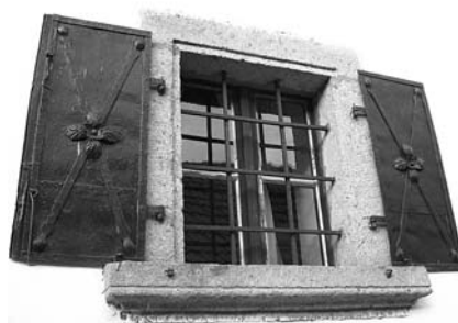
Ablakrácsok és vas „zsalugáter”