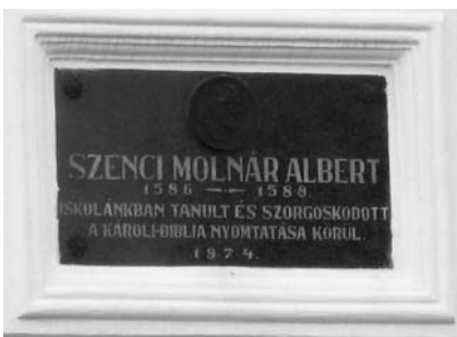
Szenci Molnár Albert emléktáblája a gönci templomfalán