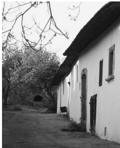
A „huszita ház” varázslatos udvara