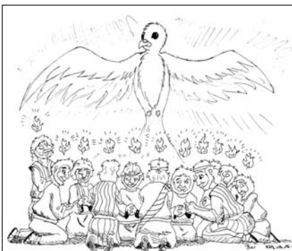
Együtt voltunk, egy akarral... (Bóta Noémi)