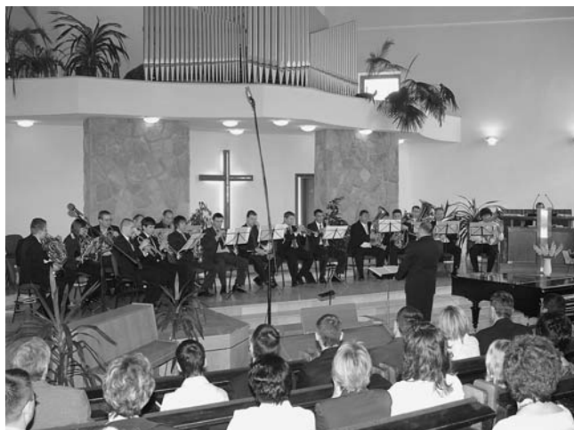
A Jó Pásztor Ökumenikus Fúvószenekar játszik Pesterzsébeten a tavaszi zenés evangélikáció

Pesterzsébeten, április 27-én 17.00 órakor