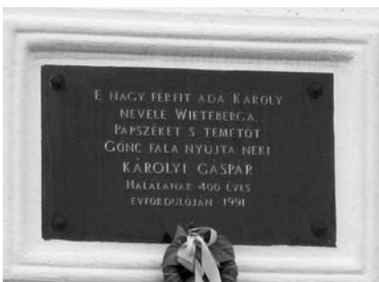
Károli-emléktábla a templom falán