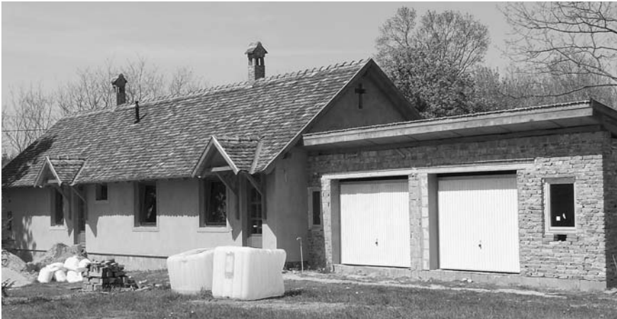
A ház a 10x5 méter alapterületű „garázzsal”, amit többek között ebédlőnek is fogunk használni. (A garázsajtókat is ajándékba kaptuk!)