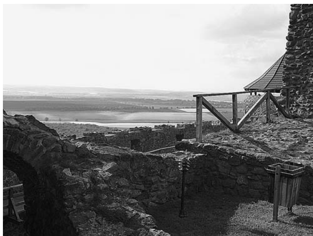
A kissé borús idő ellenére is gyönyörű kilátás nyílt a zempléni tájra