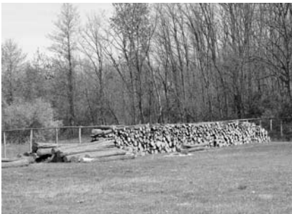
A legújabban kitermelt akác tűzifa és rönkök