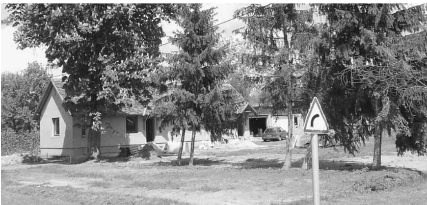
Lassan zöldül a frissen vetett fű a fenyők és a virágzó – közel 100 éves – gesztenyefa körül

burkolása, a járdaépítés, a lépcsőkorlátok elhelyezése. Szivattyúház, sátorrábor, kültéri melegvízes zuhanyozók létesítése, belső szerelvényezés, világítótestek felszerelése, kint és bent, festés, mázolás, bútorozás. Ezek csak címszavak. Akik építkeztek már, azok tudják, hogy erre két hónap nagyon kevés idő. Az időnél már csak a pénz a kevesebb. Mégis kiűztük az átadás napját. Július 27-re, a Sőkepusztai Konferencia délutánjára. Hisszük, hogy elég lesz az idő is, meg a pénz is. Napról napra tapasztaljuk az Úr csodáit, és tudjuk, hogy aki elindította ezt a munkát, az garantálja is a befejezést.