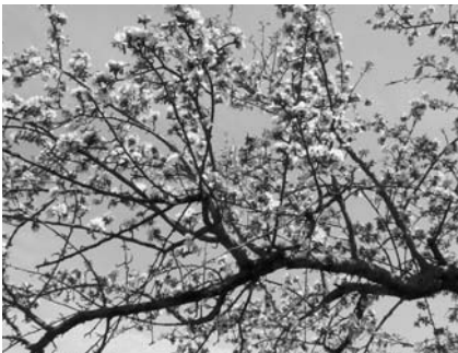
Virágzik az almafa a kertünkben