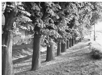
Gesztenyesor a „huszita házzal” átellenben