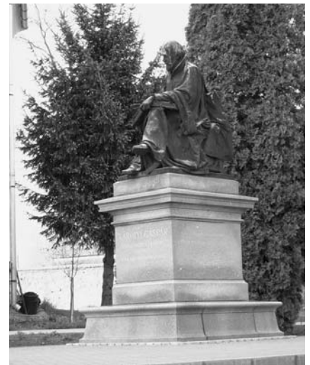
Károli bronzszobra a gönci templom parkjában