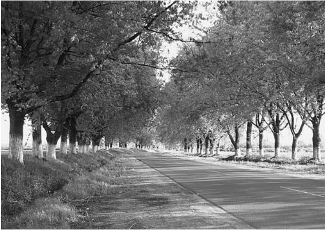
Vizsolyból Gönc felé gesztenyesor szegélyezte virágos alagúton indultunk