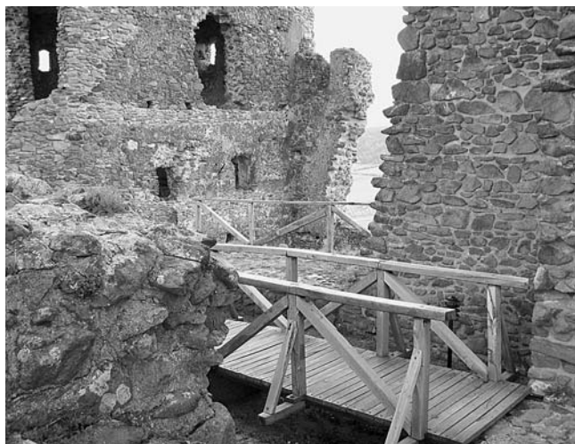
Átjáró a felső várba