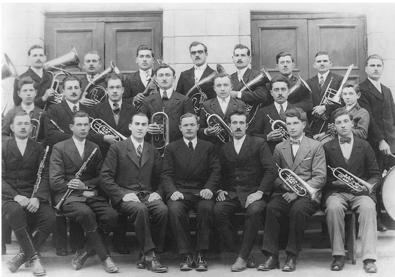
A fénykép 1936-ban készült Kiskőrösön.