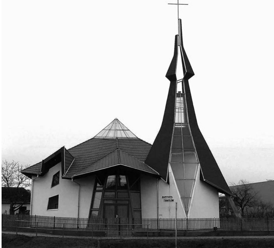
Az új dunaujvárosi Baptista Imaház

(A dunaujvárosi baptista gyülekezet templomot épített)