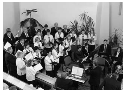
A pesterzsébeti kamarakórus énekel