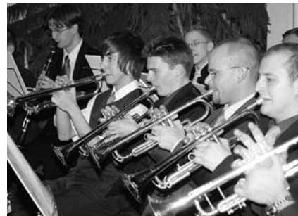
Néhányan a fúvósok közül