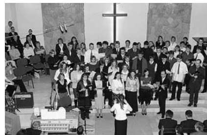
Az ifjúsági kórus