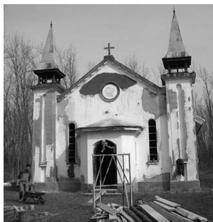
Megmenekül az imaház az enyészettől – újravakolt falak

Az ünnepi megnyitó után közös ebéddel várjuk a résztvevőket. A főző-sütő „versenyre” már eddig is sokan jelentkeztek. A halászlé, pörkölt, gulyás és egyéb után a fiataloknak sportrendezvényeket szervezünk, a gyerekeknek különféle játékokat, mások el-sétálhatnak a halastavakhoz (természetesen horgászni is lehet) vagy az Aranyos-patakhoz, ahol bizony valamikor aranyat mostak, az 1920-as évektől kezdve pedig a bemeríté-