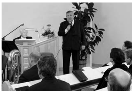
Dr. Kálmán András polgármester köszönti a gyülekezetet

vább folytatódott a meglepetés-sorozat: szószék, gyönyörű új padok, székek, bemelegítő medence, világítás, karzat, nagy, világos, tágas tér, és több mint kétszáz ember.