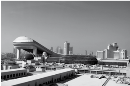
A fedett sípálya kívülről, egy bevásárlóközpont széléhez illesztve