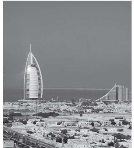
A Burj al Arab hotel a tengerparton

Több mint kétévnyi levelezés, szervezés és várakozás után 2013 novemberének közepén végre elérkezett az indulás napja: az In Medias Brass rézfúvós kvintett hangszerekkel, bőrröndökkel felpakolva a Liszt Ferenc repülőtérén várta a Dubaiba tartó járatát.