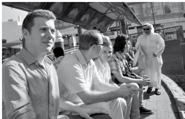
Olcsó vízi taxi Dubai belvárosában

ném megtudni, mennyibe kerül itt egy éjszaka... A harmadik épület a Burj Khalifa, amely jelenleg 828 méterrel és 168 emelettel a világ legmagasabb felhőkarcolója. Ez közelről szinte befogadhatatlan méret. Eszembe jutott az a bizonyos épület, amelyet szintén úgy kezdtek építeni, hogy „teteje az égig érjen”, mondván: „szerezzünk magunknak nevet, hogy el ne széledjünk az egész föld színén.” (1Móz11,4). Bármilyen lenyűgöző látványt jelentettek, főleg ez az utóbbi félelmetes és nyomasztó hatást keltett. Az az ének járt a fejemben, amelynek első versszaka és refrénje így szól: „Nem arany és nem ezüst, nem kincs az óhajom; Tudni csak azt szeretném: Uram szeret vajon? Nincs nyugalma lelkemnek, bizonyosságot vár: Élet könyvébe vajon, nevem beírva áll? Hogy nevem ott álljon, csakis azt