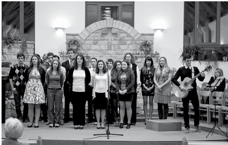
Az ifjúság énekel