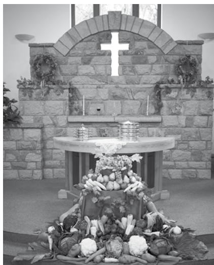
Az Úrszta a hálaadónapi oltárral