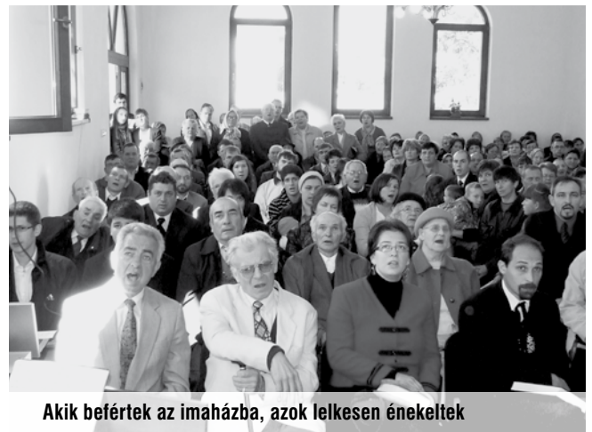
Akik befértek az imaházba, azok lelkesen énekeltek