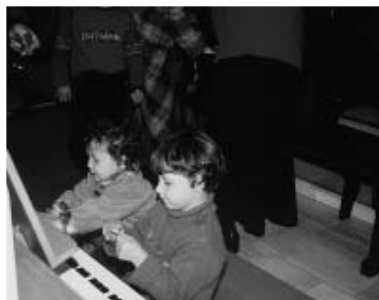
A két kislány az orgonát próbálgatja