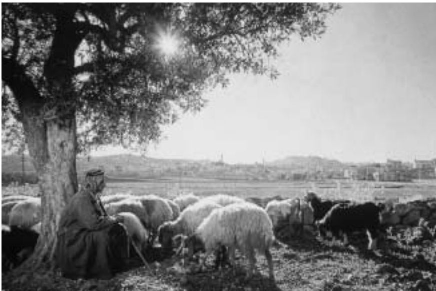
A betlehemi mező ma. Hátterben a város

Aranyat, tömjént és mirhát hoztak a napkeleti bölcsek. Ahol ők éltek, ezek lehetnek a legértékesebb kincsek, és hogy méltó ajándékokat vigyenek az új királynak, a hosszú út minden kockázatát vállalva hozták drága értékeiket. Pedig még az sem volt biztos, hogy odatalálnak, hogy csakugyan megérkeznek.