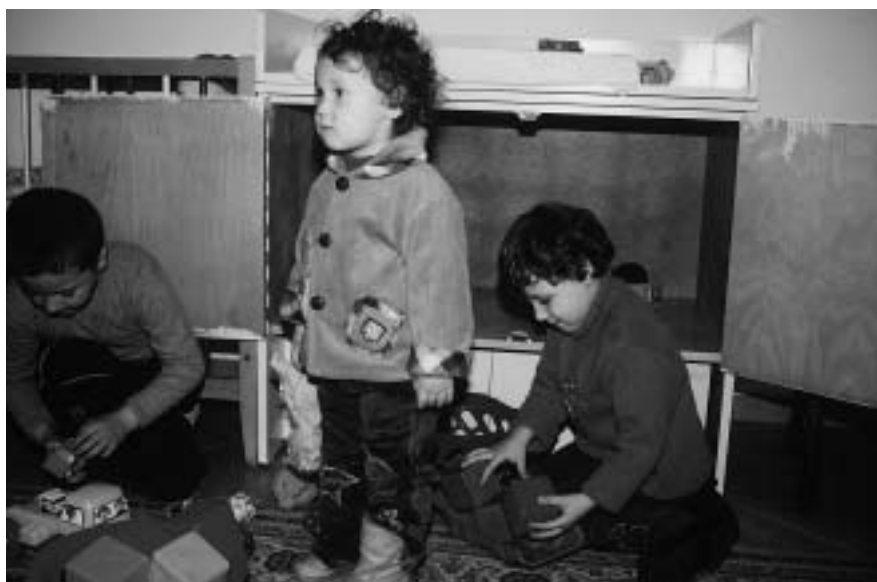
A játszószobában is csak alig-alig oldódik a feszültség