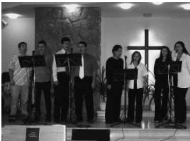
A közös éneklést vezető együttes

(Missziókerületi Értesítő 2004. november-december, 5. szám)