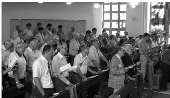
A konferencia résztvevőinek csoportja

A MBE alapokmányainak egyik legsúlyosabb hiányossága az, hogy évtizednyi mulasztásos alkotmányosértéssel a legjelentősebb szolgálati területek „rendtartása” hiányos, nem készültek el teljes körűre, s ezzel a mulasztással teret, lehetőséget adott a különféle hagyományok, átöröklő-