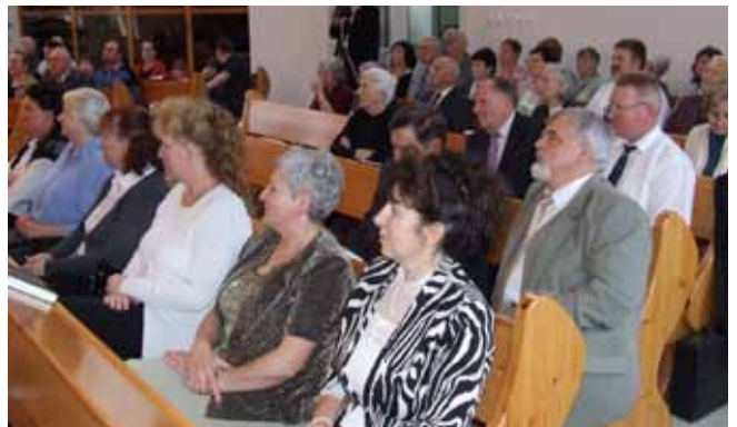
A gyülekezet egy része