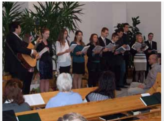
Az ifjúság énekel

Október 19-én a Dömsödi Zeneiskola igazgatója, néhány tanára és dolgozója látogatott el hozzánk a gyülekezetbe, remek kis hangversennyel kapcsolódtak az istentiszteleti szolgálatokhoz.