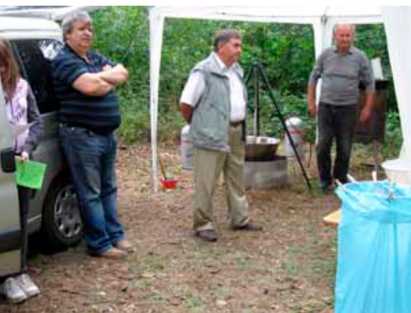
• Hárman a dömsödi csapatból,