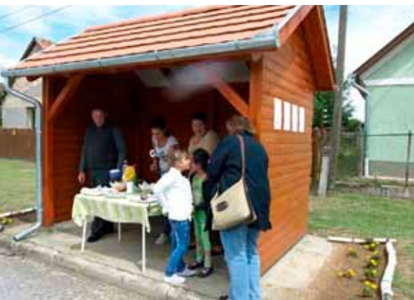
• A buszmegálló átalakult, a libiciek vendégül látták az utcán sétálókat.