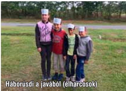
Háborúsdí a javából (élharcosok)

Eső ide, eső oda, végső soron nagyon is jól telt a gyerekhét, rengeteget tudtunk játszani, énekelni, beszélgetni, tanulni és még napsütést is kaptunk egy számháború idejéig.