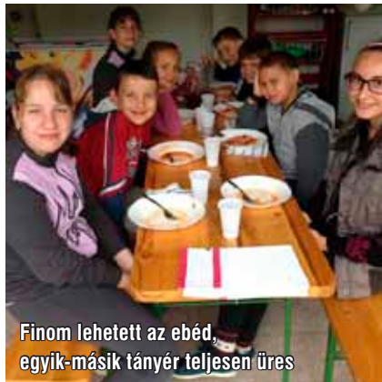
Finom lehetett az ebéd, egyik-másik tányér teljesen üres

Az ifiórákon tapasztaltak alapján három nagy témával készültem. Az első alkalommal arról a kettős érzésről beszélgettünk, amivel felnőve, lassan-lassan kiszabadulva a szülői felügyelet alól, szembe kerülnek: egyfelől a világ csábítása, a szabadság, az önállóság, amire vágyva vágnak, másfelől pedig a lelkiismeret furdalás