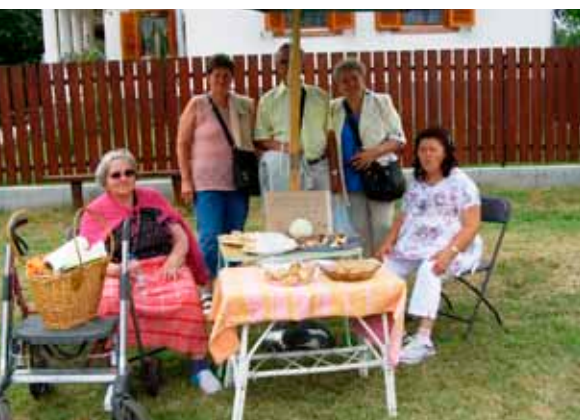
• Kapós volt az utcai „büfé”