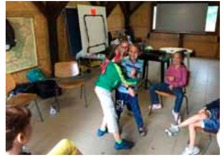
Ez az igazi