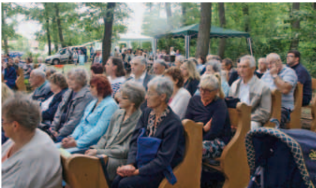
A gyülekezet egy része