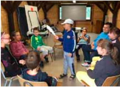
A gyerekek játék közben