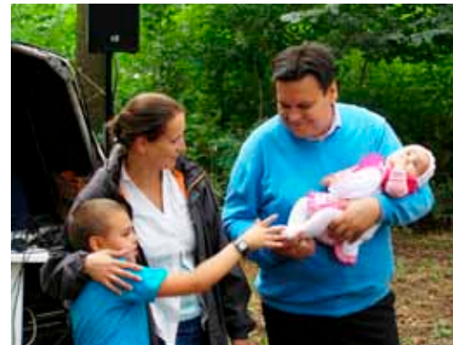
A Szappanos család