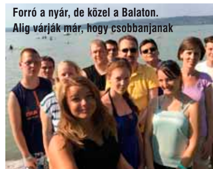
Forró a nyár, de közel a Balaton. Alig várják már, hogy csobbanjanak