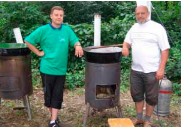
• A monoriak készülődnek