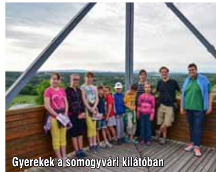
Gyerekek a somogyvári kilátóban

pedig még épp csak kezdetét vette, remélem, ősszel ott folytatjuk, ahol a táborban abbahagytuk.