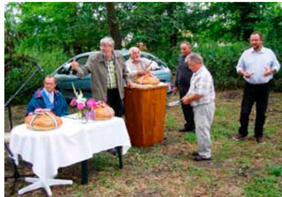
• Kezdődik a kenyérosztás