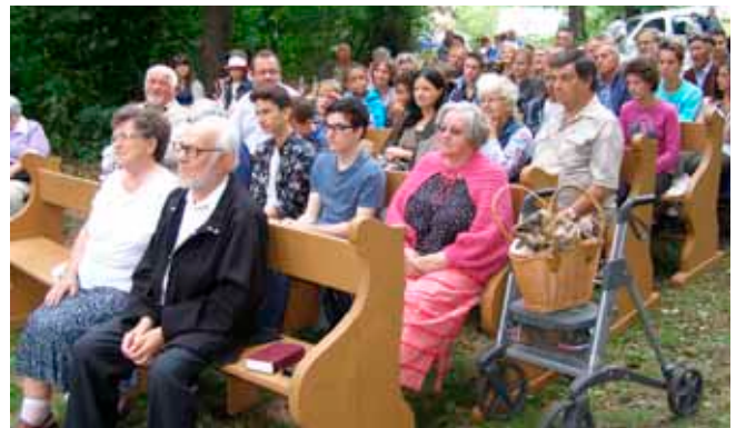
Néhányan a jobbszárnyról