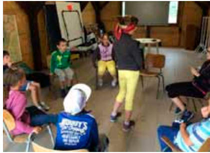
Bekötött szemmel nehéz látni