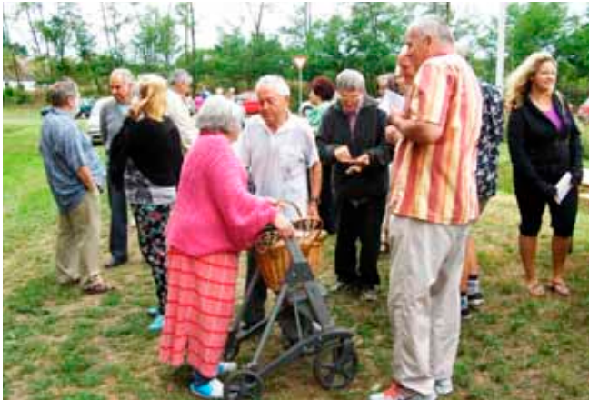
A szőkepusztaiak érkeznek