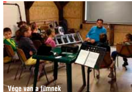
Vége van a filmnek

A táborok véget értek, a nyár is lassan a végéhez közeledik a jó munka