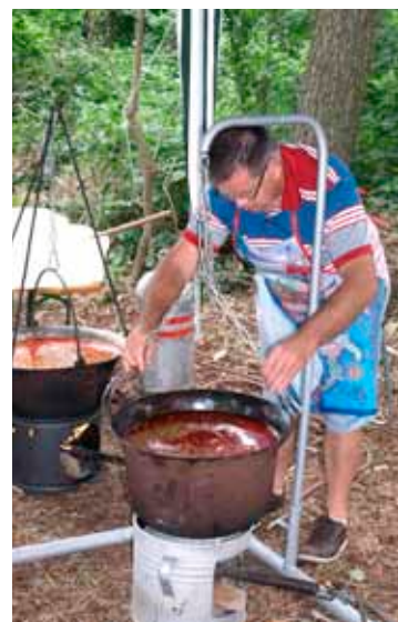
• Készül a dunaújvárosi halászlé