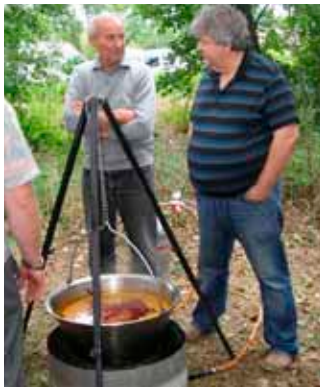
• A dömsödi birkapörkölt már majdnem kész