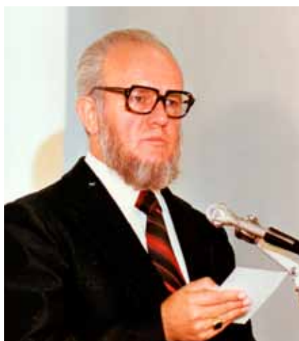
Ezt a képet terveztük a „...MÁS” című kötet hátsó borítójára

Hívó körökben a versírók szinte kizárólag imaházban elszavalható verseket írtak. Ez volt a trend. A költő viszont (ha hívó, akkor is) az élet legkülönbözőbb eseményeit, tárgyakat, tájakat, érzelmeket, bút, bánatot, örömet, bosszúságot, haragot, stb. énekel meg. Gerzsenyi Sándor költő . Itt nem a szavalható, hanem az elgondolkodtató, eszméletű, vagy éppen játékos humoros „tüskék” „szilánkok”, no meg versek következnek. –am–