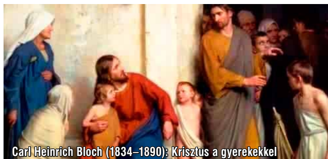
Carl Heinrich Bloch (1834-1890): Krisztus a gyerekekkel

Barátaim, önök is fognak még hasonló próbába kerülni. Nem kell hozzá az Államrendőrség.