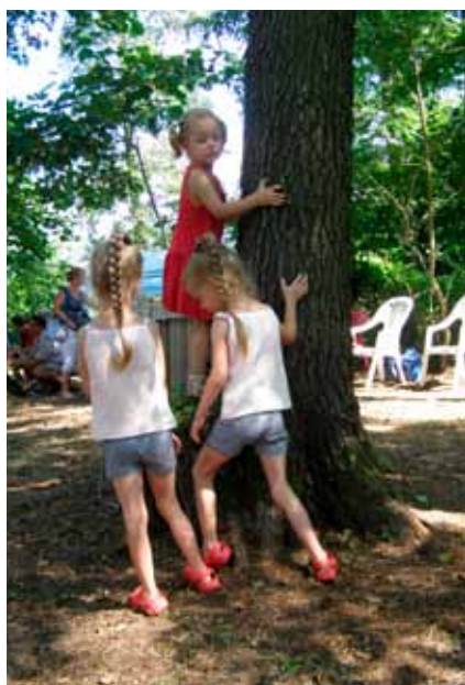
Messze van még a fa teteje