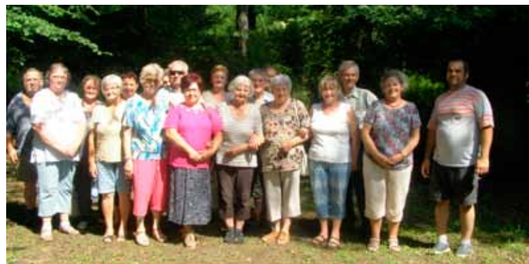
A Szőkepusztai Baráti Kör tagjainak egyik fele a találkozó után. A másik csoportról is készült felvétel, ők kimentek az imaházhoz (ld. címdal)