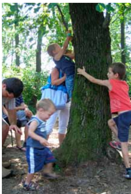
A fiúk sem maradhattak le