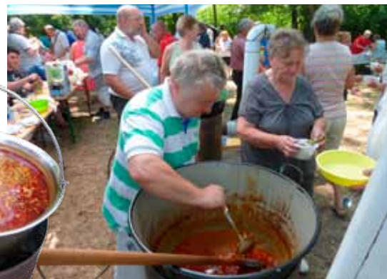
Lassan elfogy a birkapörkölt