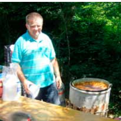
A dunaújvárosi csülkös bableves elkészült