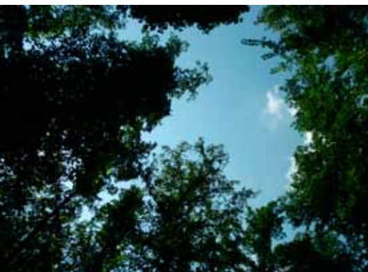
A lombkorona mint egy bazilika boltozata védte a konferenciázókat a Jó Pásztor erdőben