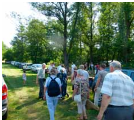
Érkeznek a konferenciázók