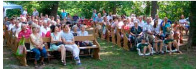
A gyülekezet egy része – a „középső hajó”