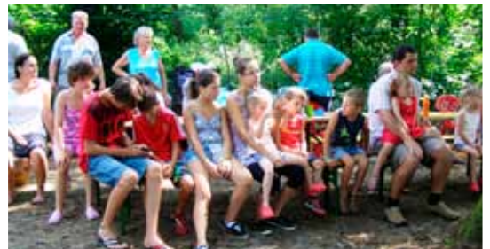
Az egyik gyerekcsapat