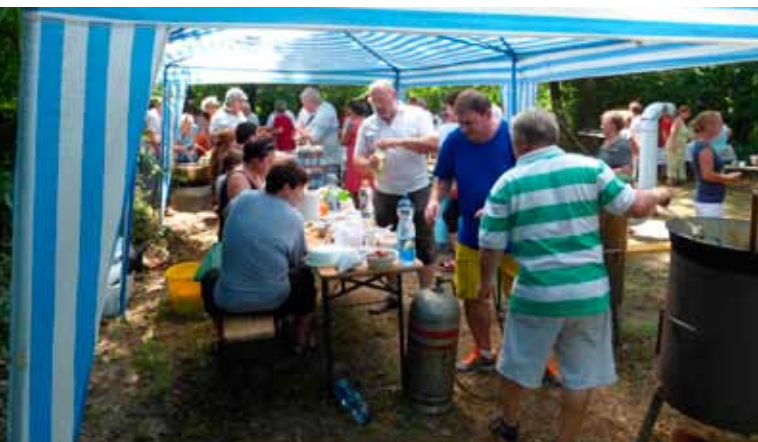
Nagy a forgalom az üstök körül