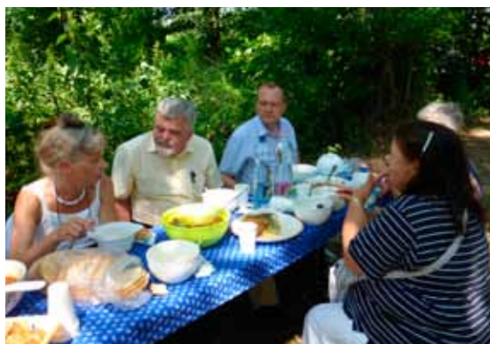
Ebédelők egy csoportja