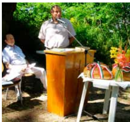
Horváth Gábor polgármester üdvözlöi a konferenciát