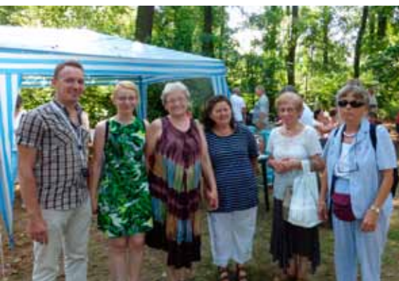
Érkeznek a vendégek