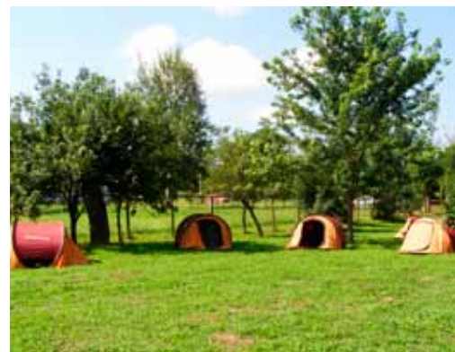
Már van egy-két sátor, de mennyi lesz majd a gyerektáborban