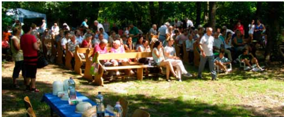
Lassan kezdődik az ebéd