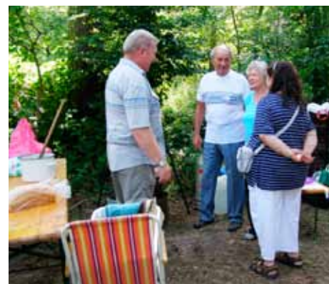
A dömsődiek készülődnek a főzéshez