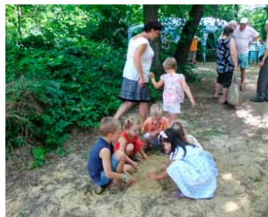
Épül a homokvár