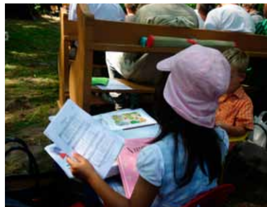
Már kottából is énekelünk

Jó kép a gyerektábor Jó Pásztor házáról, még sátrak nélkül – este indul a táborozás