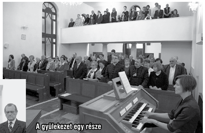
A gyülekezet egy része

főlvatott lelkipásztor, székfoglaló igehirdetése végén elénekelt a „Tégy foglyoddá Uram, akkor szabad leszek...” kezdetű éneket. Jelen voltak és köszöntést mondtak a helyi lelkipásztorok és Dömsöd polgármestere.