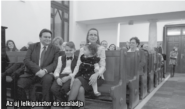
Az új lelkipásztor és családja