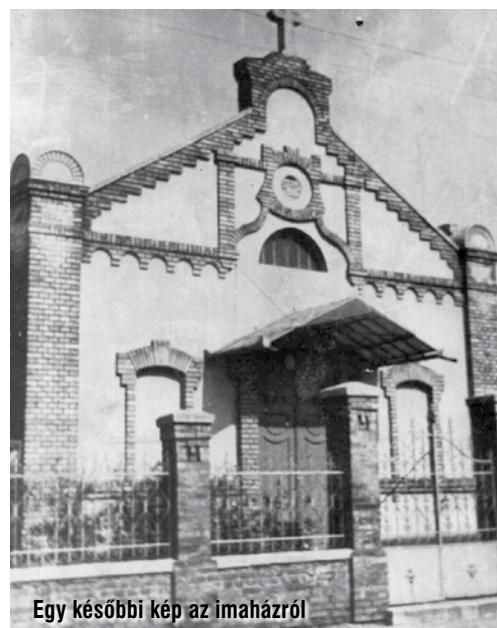
Egy későbbi kép az imaházról

(Békehírnök, 1906. augusztus 15., 233. old.)