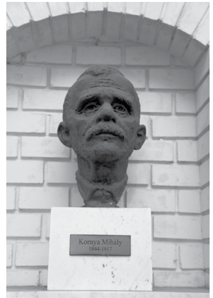
Bottos Gerő szobrászművész bronz Kornya-portréja a Benczúr utcai székház és Teológia belső udvarában

A Kornya Krónika II. kiadása Amerikában jelent meg 1965-ben Balla B. György New York-i nyug. magyar baptista lelkipásztor kiadásában. Az ő előszavából is idézek néhány sort: