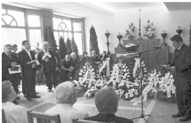
Gyászistentisztelet a ravatalozóban

A gyászolóknak Isten vigasztaló kegyelmét kívánjuk.