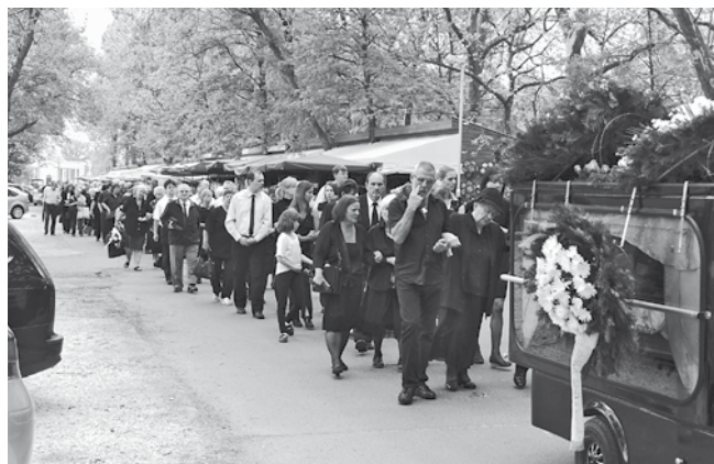
A kopszót kísérő gyászoló gyülekezet, előtérben a család