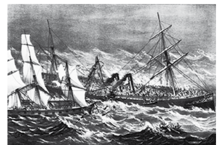
A Wille du Havre gőzös katasztrófája