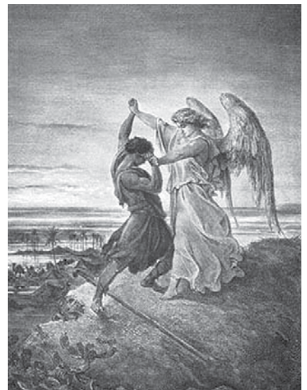
Paul Gustave Doré: Jákob tusakodása az angyallal (1855)