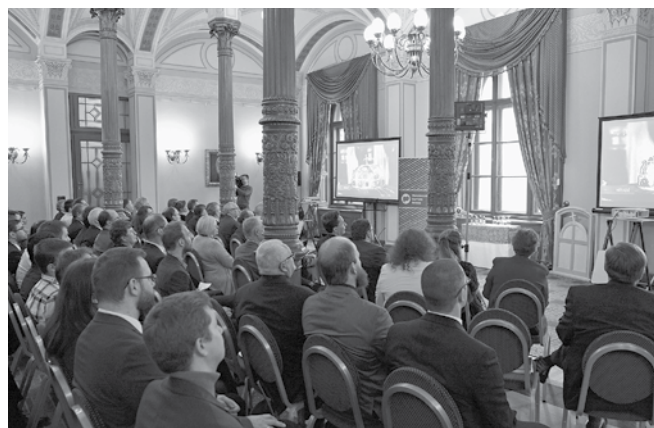
A hallgatóság egy része