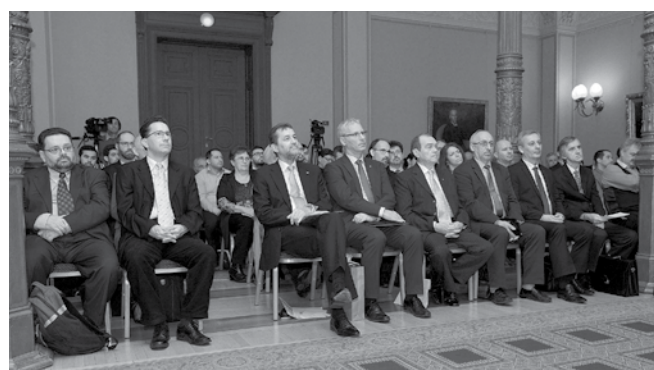
A meghívott vendégek, vezetők, előadók