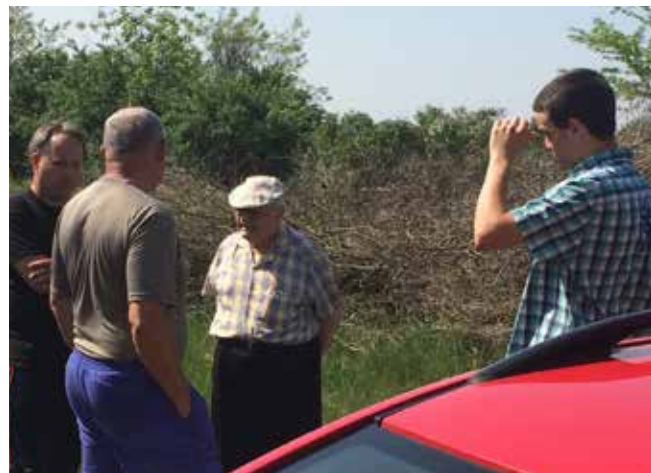
Terepmunka a Kisszállás Rohoda pusztán. Egy régi temető föltárása.