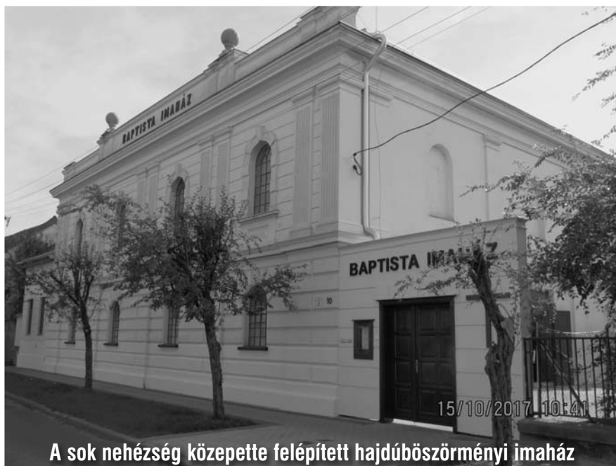
A sok nehézség közepette felépített hajdúböszörményi imaház