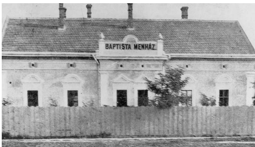
Az általa alapított menház Hajdúböszörményben – viharvert állapotban. Ma a kor igényei szerint kibővítve, átépítve működik

Ehhez járult még a szinte mindennapos olvasmány, „Az Üdv