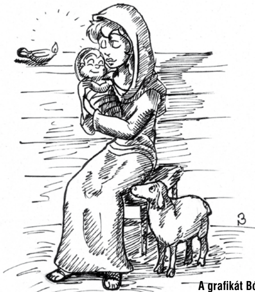
A grafikát Bóta Noémi készítette